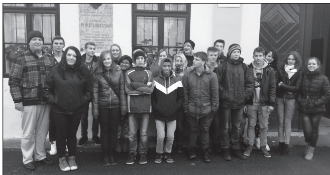
Pred Pamätnou izbou L. Podjavorinskej cez Bratislavu do Viedne a potom domov.