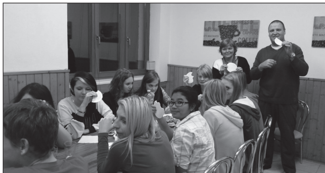
Vianočné oblátky na Hrubej Strane

Žiaci budú ešte dlho spomínať na toto pekné a zaujímavé stretnutie. Napriek tomu, že sa už poznali z „elektronických“ schôdzok, osobné stretnutie bolo chvíľočku trochu rozpačité. Zakrátko však zahrali na tvárach úsmevy, rozprúdili sa rozhovory, ozýval sa smiech a pri lúčení sa objavili v očiach aj slzičky. Vďaka Vám, priatelia, za pekné chvíle, ktoré sme spoločne prežívali počas práce na projekte i pri tomto stretnutí.