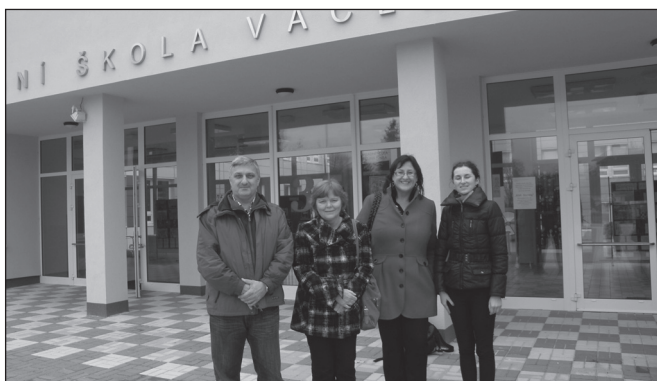
V Poděbradach pred školou

Tento prvej časti projektu sa zúčastnil riaditeľ školy, výchovná poradkyňa a zároveň učiteľka geografie, učiteľky slovenského jazyka