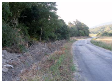
Rybnická cesta, čistenie priekop