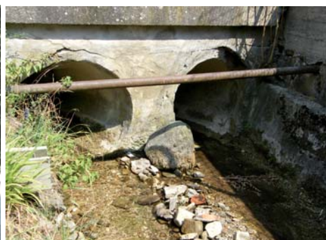
Cetuna, čistenie priepustov a priekop