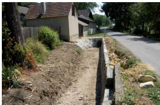
Spevňovanie brehov potoka pri Rybnickej ceste