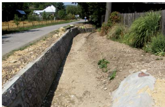
Čistenie Vrzavského potoka