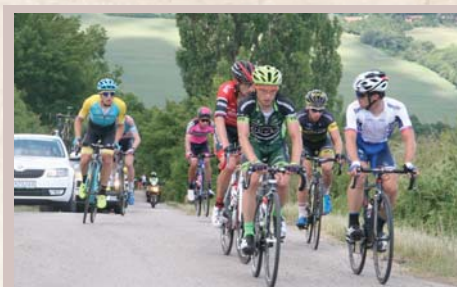
↑ Okolo Slovenska toto leto aj v našej obci.

Každý účastník si nakoniec domov odniesol svoje výtvy v darčekovom balení. Mnohé z nich skončia ako darčeky pre rodinných príslušníkov. Čo je lepšie ako z lásky vyrobený darček?