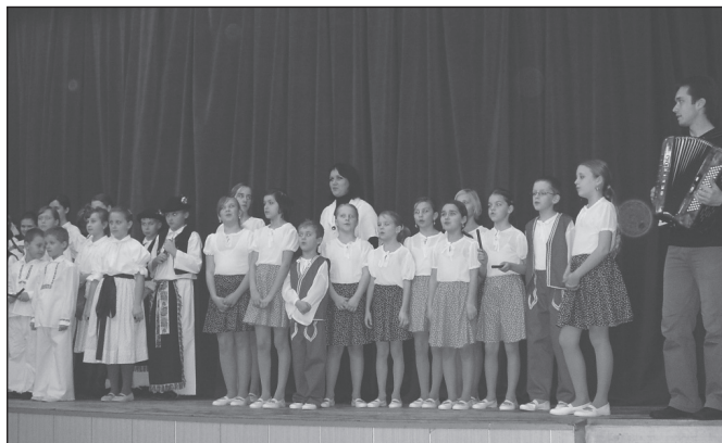
Na javisku s babickými deťmi