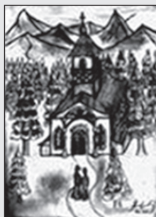
Autorka ilustrácie: Adela Zatovičová

Ajhľa! zima, bieloruča kňažná, zas za host'a zavítala k nám: strecha chyžky našej celá sňažná, pole biele, tiché ako chrám; aj tá lipka v dvora nášho kútka zaodiata v mrazný, jemný peľ, záhradôčka moja s'táby v smútku, miestom len ju krášli zimozel.