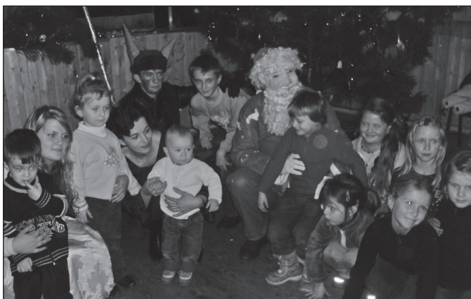
Mikuláš na Hrubej Strane

Ďakujeme všetkým, ktorí sa podieľali na príprave týchto podujatí.