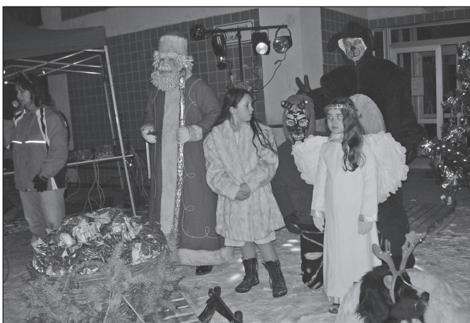
Mikuláš a jeho družina