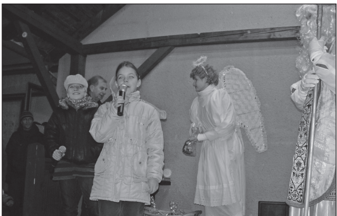
Básnička pre babického Mikuláša, anjela a čerta

Až teraz po rokoch sme opäť mali možnosť navštíviť našu družobnú obec a školu. V sobotu a nedeľu 4. a 5. decembra 2010 usporiadali naši priatelia v Babiciach Vianočné trhy, tento rok v