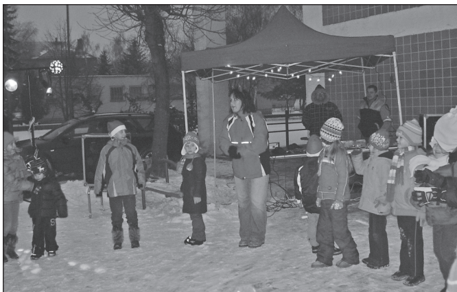
V tuhom mraze sme tancovali a čakali na Mikuláša