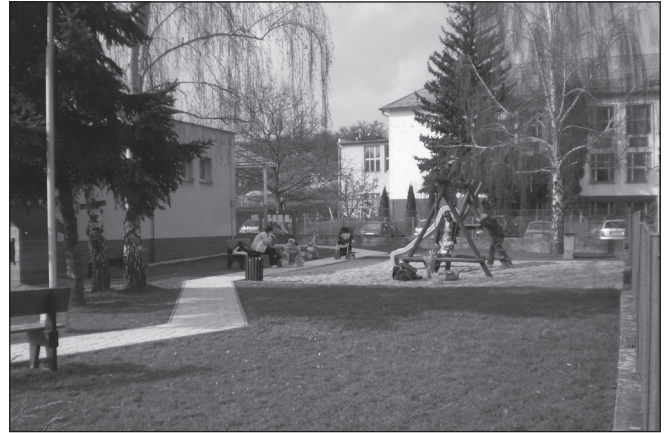
Na detskom ihrisku

V nedeľu 7. marca 2010 zorganizovala miestna organizácia Únie žien Slovenska slávnosť pri príležitosti Medzinárodného