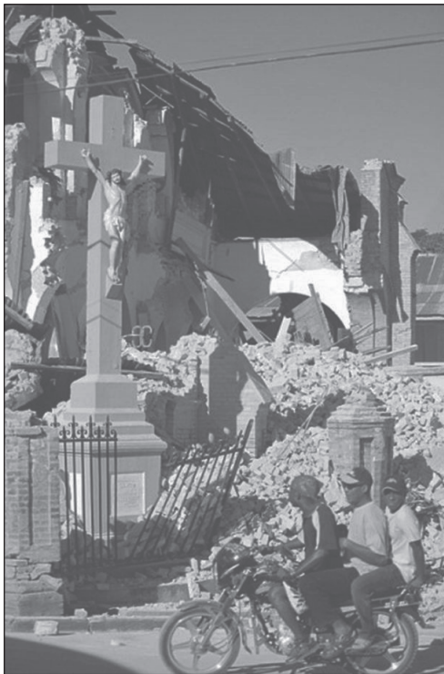
Nedotknutý kríž v zrútenom kostole na Haiti!