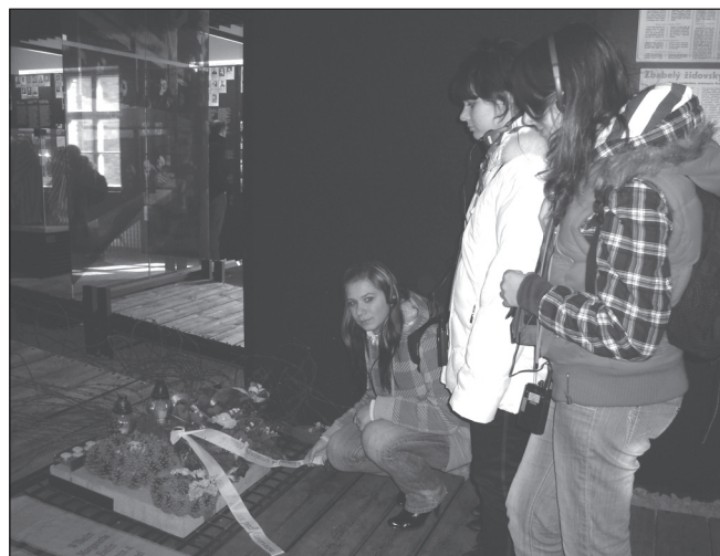
Venček pamiatke umučených rodákov