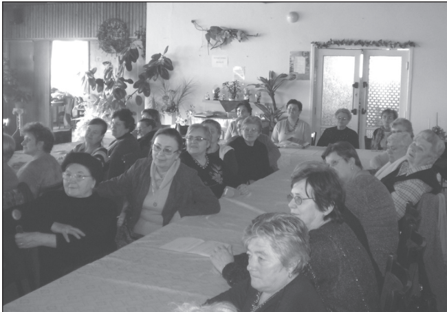
Z výročnej schôdze Jednoty dôchodcov Slovenska