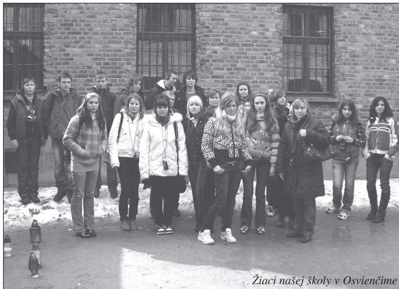
Žiaci našej školy v Osvienčime